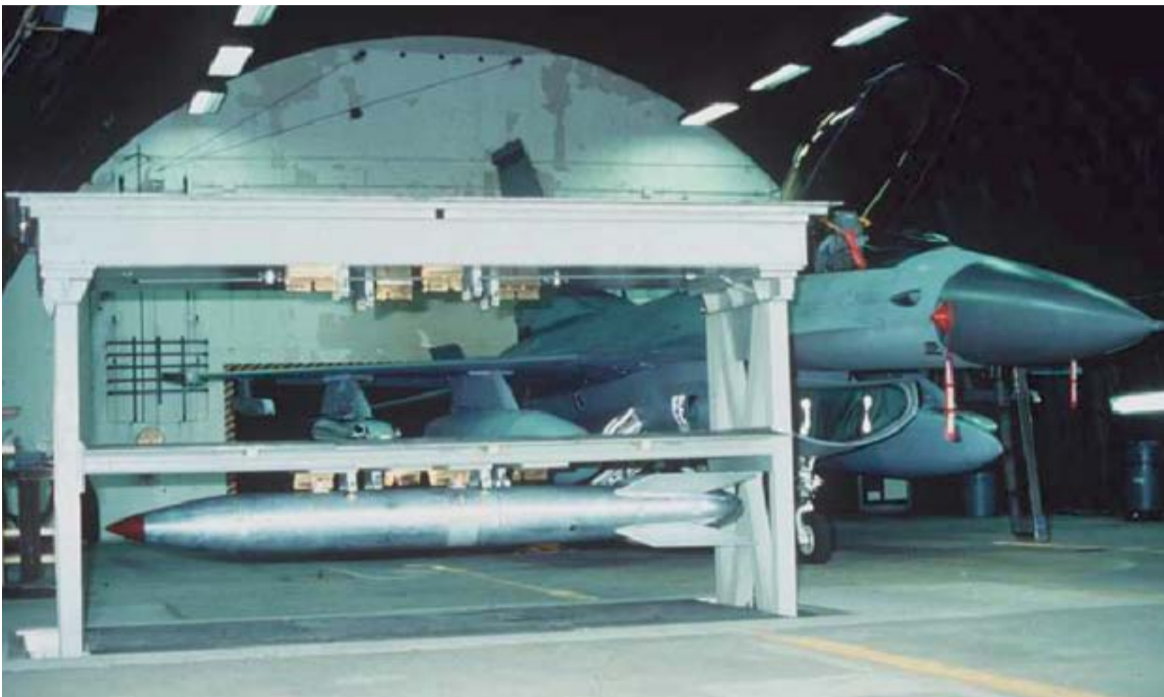
De B-61 kernbom in haar speciale bunker naast de F-16 bommenwerper waarmee zij afgeworpen kan worden

Tijdens de Koude Oorlog werden op diverse plekken in Nederland Amerikaanse kernwapens opgeslagen. Dit gebeurde in NAVO-verband. Hoewel de meeste kernwapens weer weggehaald zijn, liggen er nog altijd Amerikaanse atoombommen opgeslagen op de luchtmachtbasis Volkel in Noord-Brabant. Het gaat om zogenaamde B61-bommen, die door F-16 vliegtuigen kunnen worden afgeworpen. Nederlandse F-16 piloten van de Koninklijke Luchtmacht worden opgeleid om dit te doen.